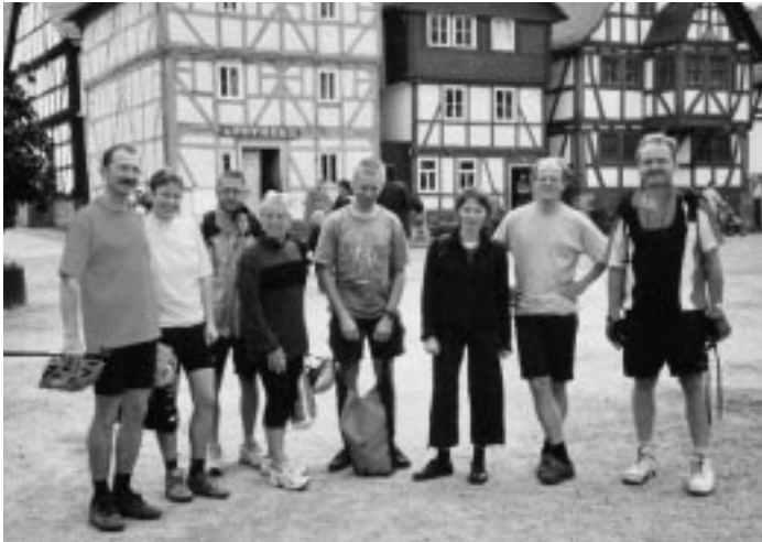
Das Ziel am 1. Mai – DGB-Fest im Hessenpark

Neues kennen lernen abseits der bekannten Strecken