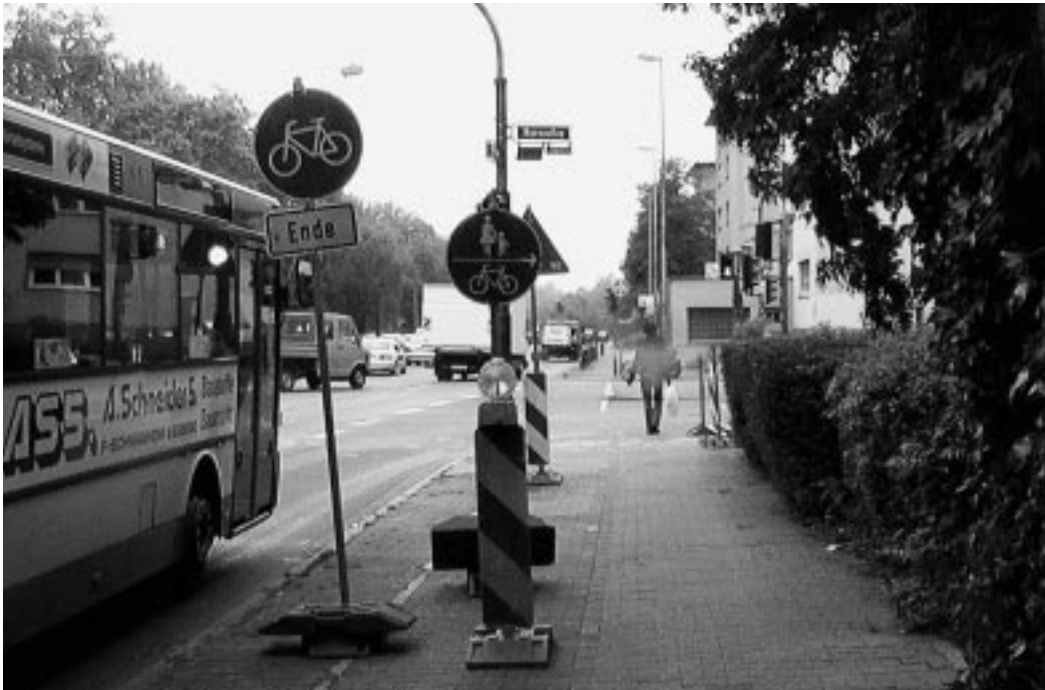
Radweg Ende in der Adickesallee – der ganz alltägliche Blödsinn