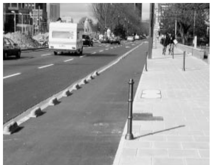
Nicht nur funktional, sondern auch ästhetisch durchaus überzeugend – neuer Radweg in der Friedrich-Ebert-Anlage mit Formsteinen zum Schutz vor Falschparkern