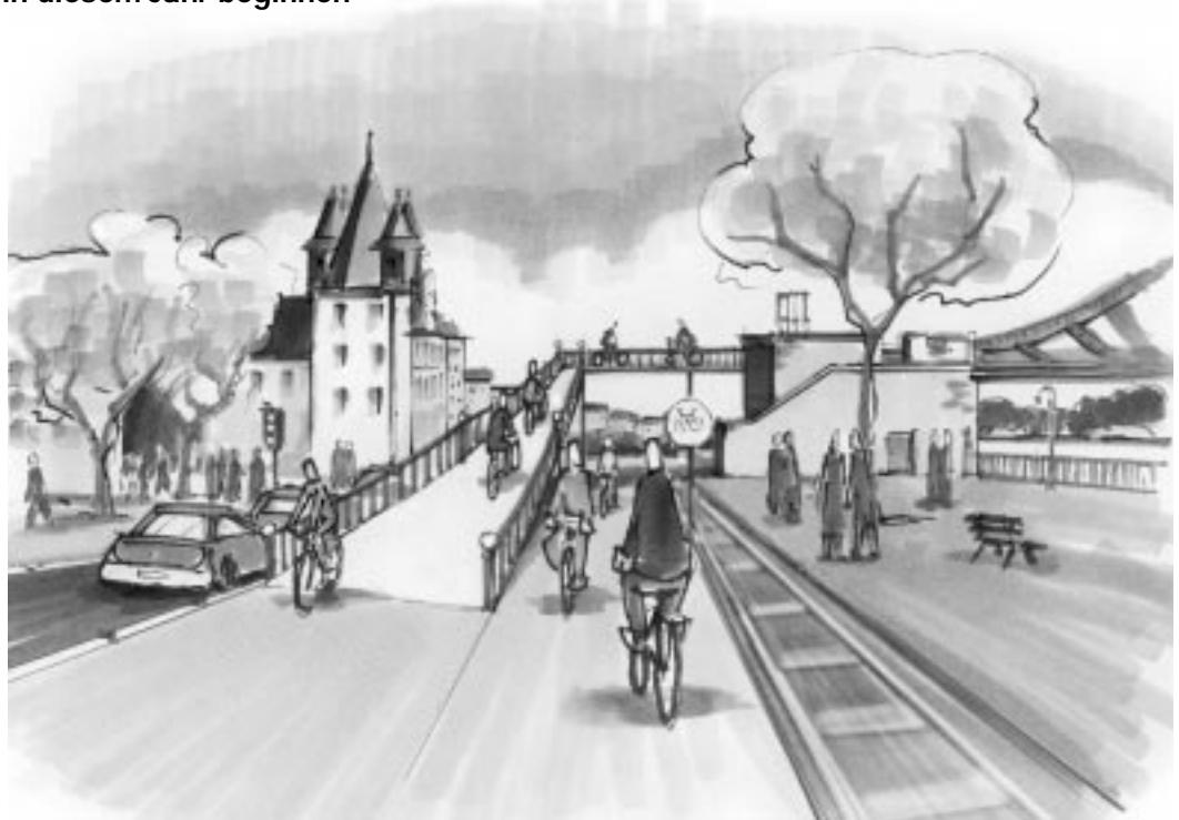
Die Rampenführung auf der nördlichen Mainseite. Ab 1. April im Modell zu besichtigen.

Wegen der geforderten geringen Steigung muss die Auffahrt sehr lang werden, so dass das Hafengebäude auf der Nordseite überbrückt werden muss. Zunächst wurde deshalb die sogenannte „große Lösung“ angedacht, die eine Brücke vom Fahrtor über den Mainkai und die Hafenbahn zum Eisernen Steg vorsah. Diese Bauweise verbraucht jedoch zuviel Platz in der Fußgängerzone, der bei