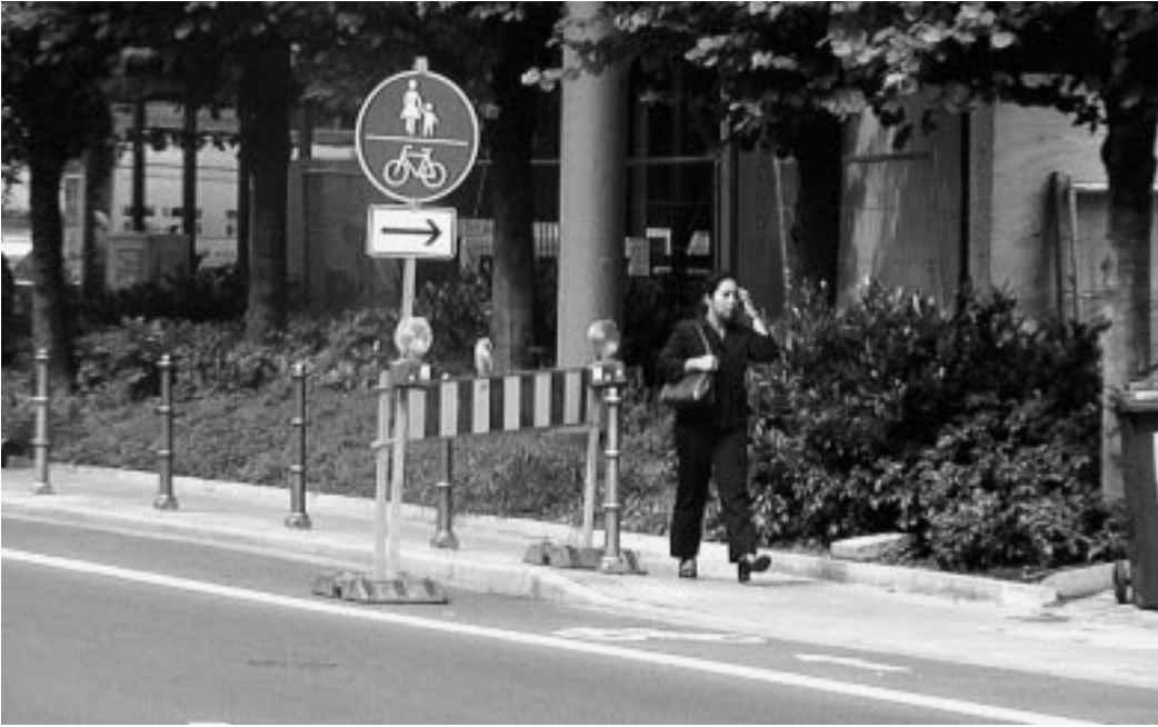
Da geht's lang -- (zeitweiliger) gemeinsamer Geh- und Radweg in der Friedrich-Ebert-Anlage