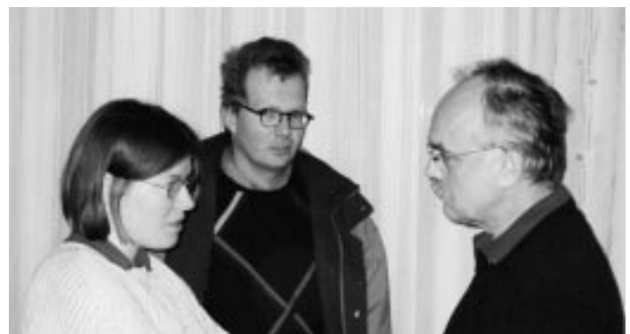
Interessante Gespräche am Rande der Versammlung.