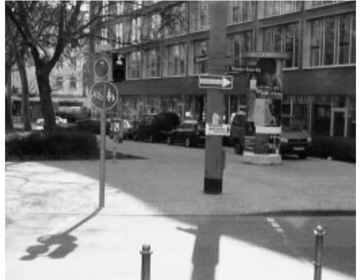
Warten auf das versprochene Asphaltband – Radweg Stresemannallee vor dem Allianz-Neubau.