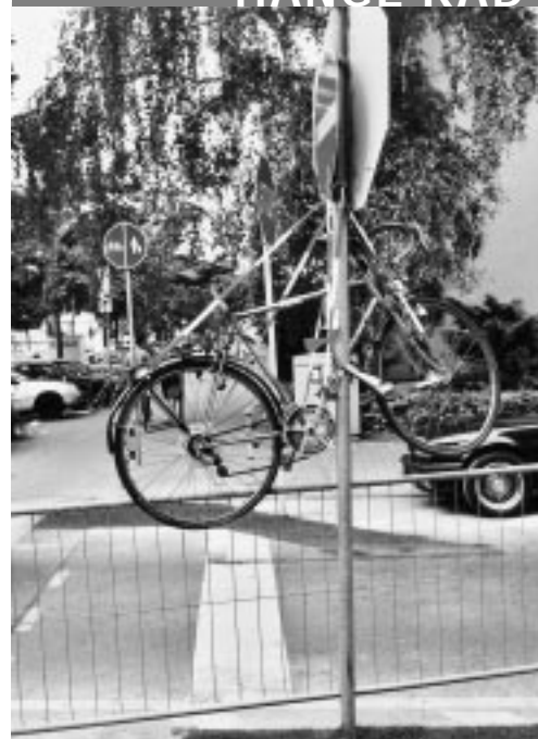
Frankfurt am Main, Feldbergstraße